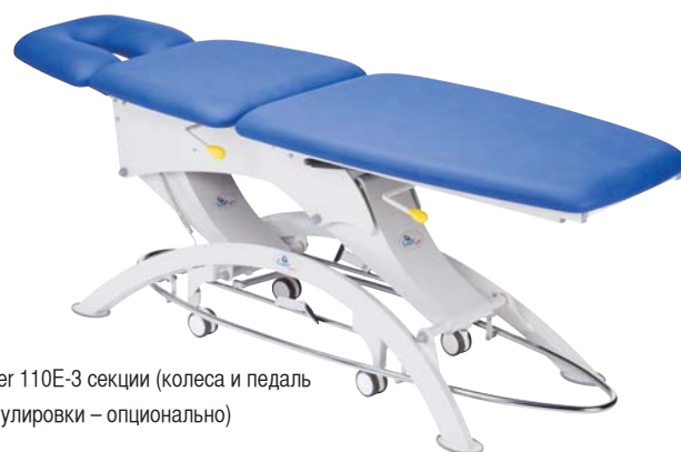
Lojer 110E-3 секции (колеса и педаль регулировки – опционально)

Lojer 115F - 5 секций (головная, средняя, ножная 2 опоры для рук)