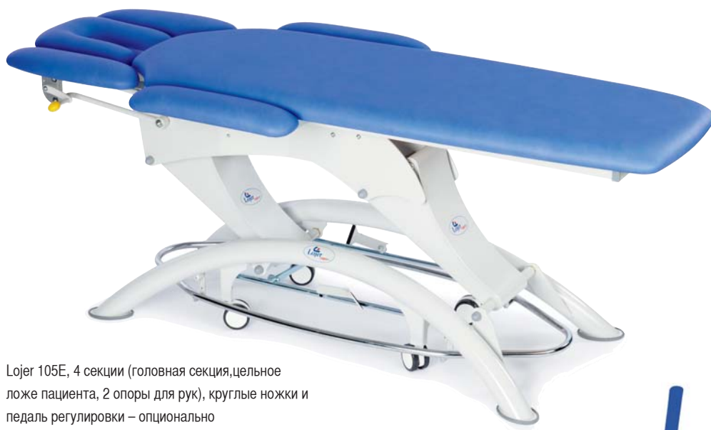
Lojer 105E, 4 секции (головная секция, целное ложе пациента, 2 опоры для рук), круглые ножки и педаль регулировки – опционально