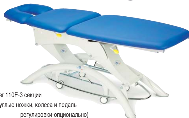
Lojer 110E-3 секции (круглые ножки, колеса и педаль регулировки-опционально)