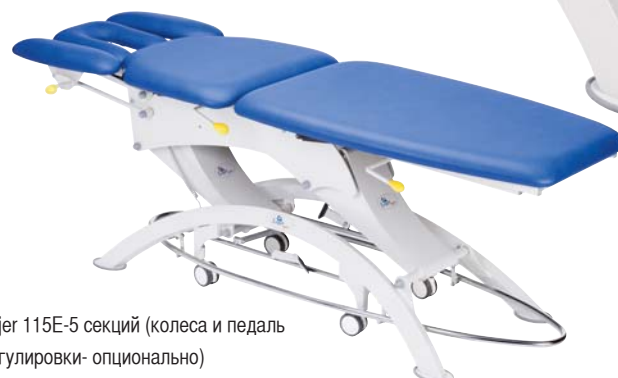
Lojer 115E-5 секций (колеса и педаль регулировки- опционально)