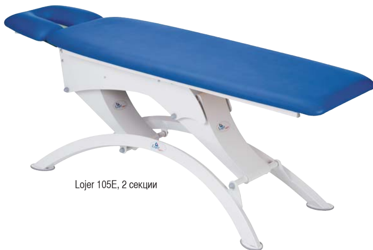
Lojer 105E, 2 секции

Гарантия: 10 лет на каркас стола, 2 года на мотор