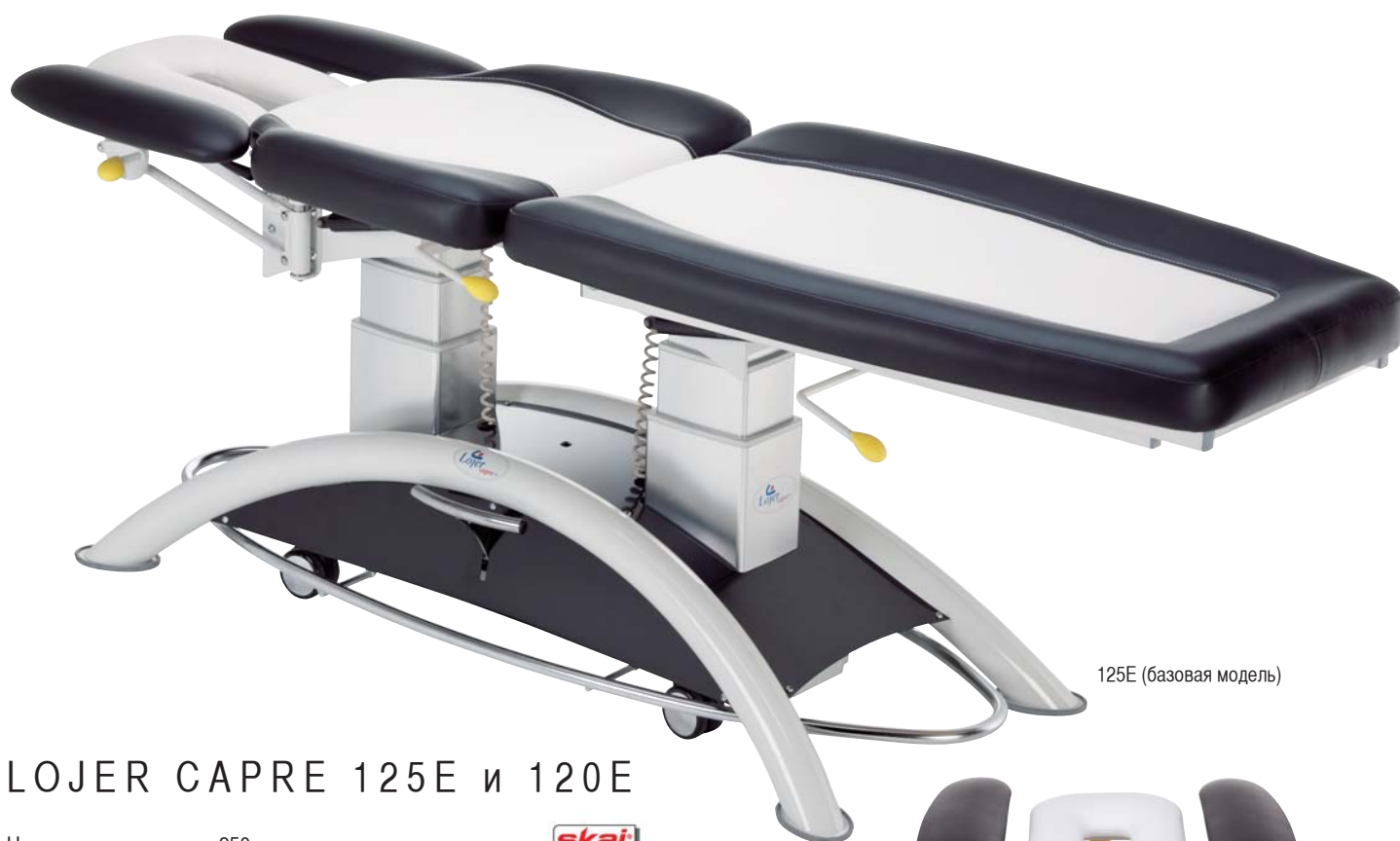
125E (базовая модель)