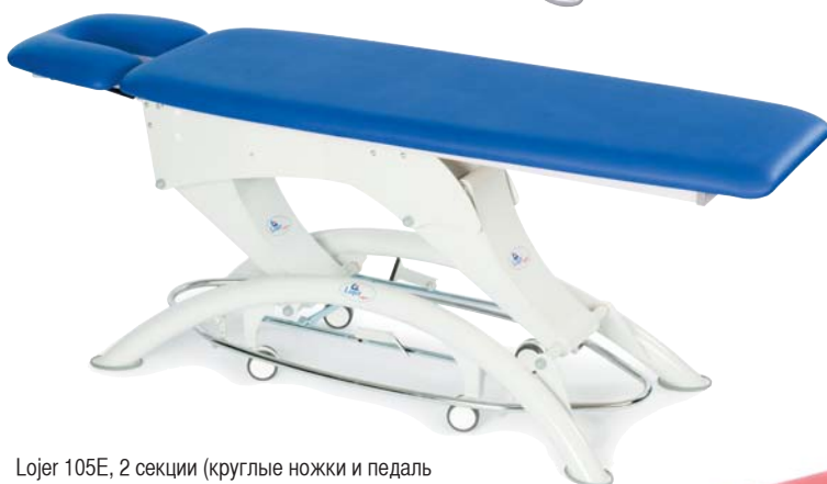
Lojer 105E, 2 секции (круглые ножки и педаль регулировки высоты - опционально)