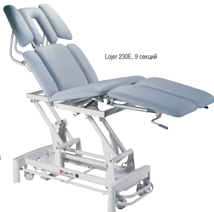
Lojer 230E, 9 секций

Стандартная девятисекционная модель имеет опоры для рук, регулируемые по высоте при помощи газовых пружин, семисекционная модель опор для рук не имеет. Обе модели имеют головную секцию с вырезом для лица. Регулировка угла головной секции от +30 до 90 град. Грудная секция с регулировкой угла положения (до +70 град.), имеет боковые регулируемые секции. Центральная ножная секция регулируется при помощи газовых пружин. Раздельные секции для ног с регулировкой угла (от +30 до -20 град.). Электрическая регулировка высоты при помощи педальной рамы в пределах 48-88 см. Центральная блокировка колес. Максимальная нагрузка 200 кг.