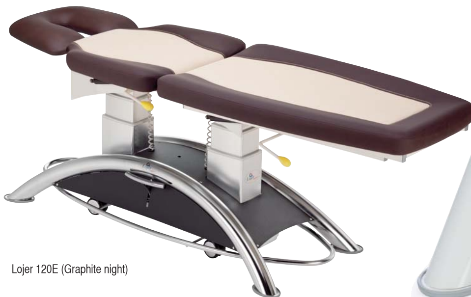
Lojer 120E (Graphite night)

Уникальный новый дизайн Большое разнообразие расцветок Передовые технологии Исключительные характеристики