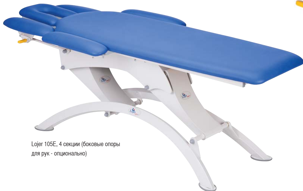
Lojer 105E, 4 секции (боковые опоры для рук - опционально)