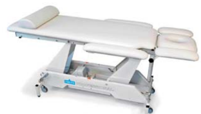
SNOW WHITE 6410907