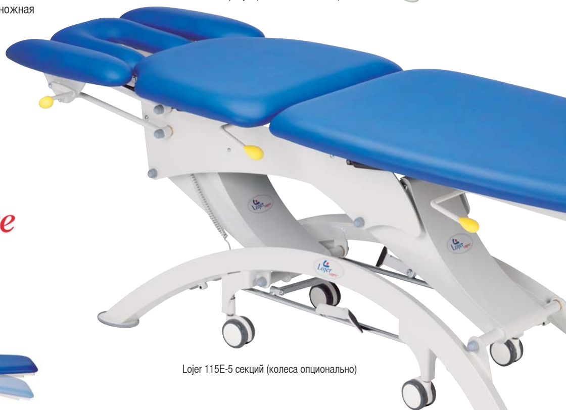
Lojer 115E-5 секций (колеса опционально)